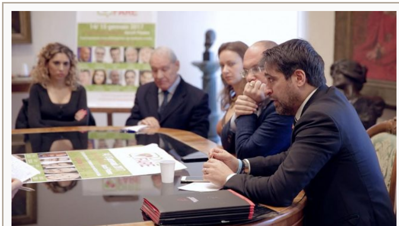
La presentazione dell’evento Dire Fare

Una doppia giornata di formazione organizzata da Performance Strategies con il patrocinio del comune di Ascoli e il contributo di numerosi partner che, anche loro a titolo gratuito, prestano la propria opera per la miglior riuscita dell’evento. I relatori che si alternano sul palco del Teatro Ventidio Basso portano ciascuno un significativo contributo al dibattito pre-ricostruzione. Non una semplice raccolta fondi, ma un punto di partenza e rilancio della comunità tutta, per una ricostruzione che significhi non solo nuove case, nuove strade, nuovi ponti, ma nuovi valori e obiettivi su cui rifondare le comunità del Centro Italia. L’intero ricavato della manifestazione verrà devoluto ad Acquasanta Terme, totalmente distrutto dopo il terremoto del 30