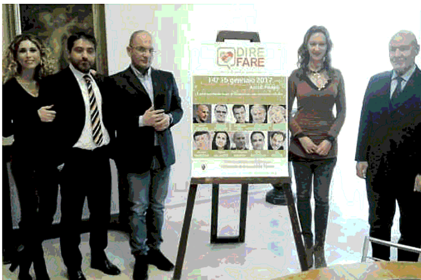
La presentazione dell'iniziativa benefica con il sindaco Guido Castelli

avrà modo di comunicare la chiave della riuscita nella loro vita. Il percorso di "Formazione per il business" vedrà, tra gli altri, Mirco Gasparotto trattare il tema "Modellare il cambiamento per creare il tuo progetto di vita", Luigi Centenaro "Come sopravvivere a globalizzazione, internet e trasformazione digitale", Arrigo Sacchi spiegare "Le regole d'oro per creare spirito di squadra", Oliviero Toscani raccontare "Una storia di creatività e sregolatezza". Tra gli esperti che daranno invece vita al percorso di "Formazione per lo Sviluppo Personale" ci saranno anche Mario Furlan (fondatore dei City Angels), Igor Sibaldi, Pupi Avati, Josefa Idem. E ancora le parole di Maurizia Cacciatori Mario Tozzi, Niccolò Branca, Italo Pentimalli, del Generale Franco Angioni.